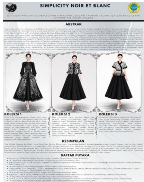
Gambar 2. Desain busana batik monokrom berbasis konsep zero-waste

Penilaian ahli desain dan guru tata busana menunjukkan bahwa rancangan busana telah memenuhi unsur estetika dan fungsi. Siluet busana dinilai memiliki keseimbangan antara bentuk, proporsi, dan kenyamanan. Akan tetapi, ahli juga menekankan pentingnya penyempurnaan pada detail konstruksi agar kualitas jahitan konsisten, terutama karena teknik zero-waste dapat menghasilkan bentuk potongan yang tidak selalu simetris atau mengikuti pola konvensional. Masukan ini penting sebagai dasar perbaikan produksi berikutnya.