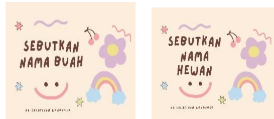
Gambar 3. Kartu Tantangan

Permainan alphabetic ladder snake di desain dengan di sesuaikan dengan kombinasi warna yang menarik serta sesuai dengan kebutuhan anak.