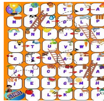
Gambar 2. Alphabetic Ladder Snake

Penelitian dengan menggunakan metode penelitian tindakan kelas model Kemmis dan Mc Taggart ini berjudul Upaya Meningkatkan Kemampuan Mengenal Huruf Melalui Permainan Alphabetic Ladder Snake pada Anak Usia 5-6 Tahun di RA Salafiyah Wonoyoso yang berjumlah 26 anak yaitu 14 laki-laki dan 12 perempuan. Sebelum tindakan di lakukan, peneliti membuat desain alphabetic ladder snake yang akan di gunakan serta mempersiapkan kelengkapan alat dan bahan, baik alat dan bahan yang akan di gunakan untuk permainan ataupun untuk dokumentasi. Dokumentasi menggunakan kamera handpone.