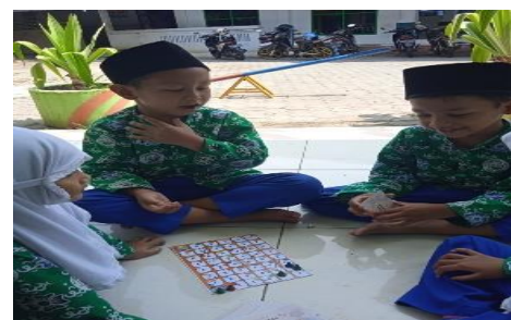
Gambar 4: Pelaksanaan Tindakan

Kartu tantangan di dapatkan anak setelah anak melempar dadu dan menjalankan pion. Anak menjawab pertanyaan seperti di gambar sesuai dengan huruf yang anak dapatkan.