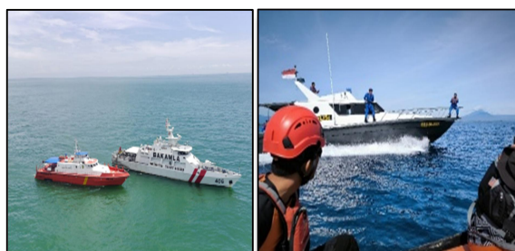
Gambar 8 Manfaat Sinergi Dalam Operasi Gabungan