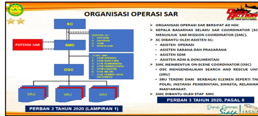
Gambar 6 Organisasi Operasi SAR

Sumber : Paparan Deputy Operasi dan Siap siaga Basarnas