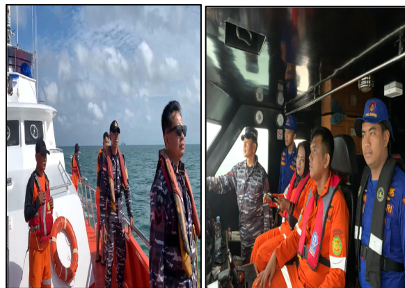
Gambar 7 Penerapan Sinergi Operasi SAR Gabungan