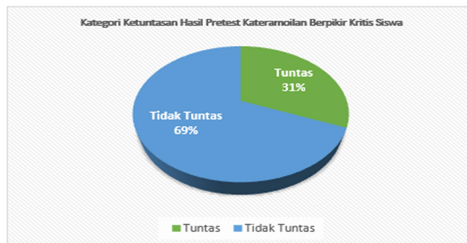
Gambar 1. Kategori Kelengkapan Hasil Pretest Keterampilan Berpikir Kritis Siswa

Berdasarkan gambar di atas, menunjukkan bahwa kategori kelengkapan Hasil Pretest Keterampilan Berpikir Kritis Siswa adalah 69% siswa yang tidak lengkap dan hanya 31% yang menunjukkan siswa yang lengkap.