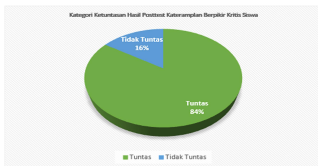
Gambar 2. Kategori Kelengkapan Posttest Tampilan Berpikir Kritis Siswa

Berdasarkan Tabel 1 tentang statistik deskriptif hasil kemampuan pretest siswa, diketahui bahwa kemampuan berpikir kritis memiliki nilai maksimal 80 dan skor minimal 55 dengan nilai rata-rata 66,56 dan standar deviasi 7,00, yang menunjukkan bahwa terdapat variasi kemampuan berpikir kritis siswa sebelum pengobatan diberikan. Sementara itu, keterampilan kolaboratif menunjukkan skor maksimal 80 dan skor minimal 50 dengan skor rata-rata 68,28 dan standar deviasi 0,72, yang menunjukkan bahwa keterampilan kolaboratif siswa cenderung lebih merata dibandingkan keterampilan berpikir kritis. Secara umum, hasil pretest ini menunjukkan bahwa kemampuan berpikir kritis dan kolaboratif siswa masih dalam kategori sedang dan belum optimal, sehingga diperlukan penerapan model pembelajaran yang lebih inovatif untuk meningkatkan kedua keterampilan tersebut.