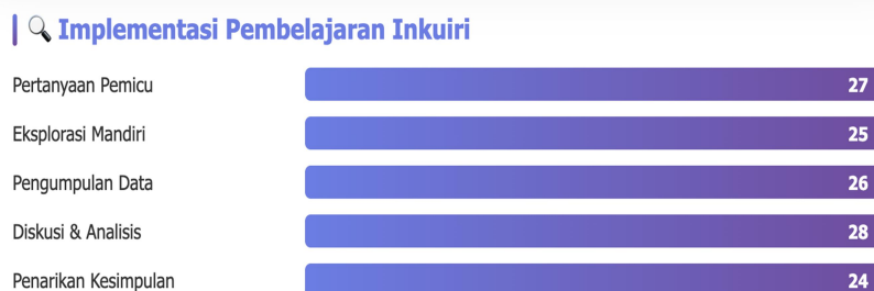
Gambar 2. Data Implementasi Pembelajaran Inkuiri

menyusun Rencana Pelaksanaan Pembelajaran (RPP) dengan memperhatikan tahapan inkuiri, yaitu orientasi, perumusan masalah, pengumpulan data, pengolahan data, dan penarikan kesimpulan. Perencanaan juga mencakup penyiapan media pembelajaran berupa gambar, teks bacaan, dan studi kasus sosial yang mencerminkan keberagaman budaya di lingkungan sekitar. Data yang di olah berdasarkan aplikasi NViVo sebagai berikut;