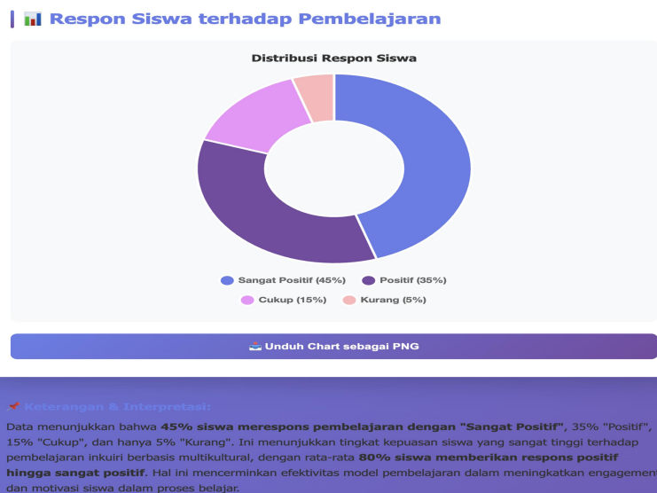
Gambar 4. Respon Distribusi Respon Siswa

Berdasarkan data pada Gambar Respon Siswa terhadap Pembelajaran , dapat diketahui bahwa mayoritas siswa memberikan respon yang sangat positif terhadap pelaksanaan pembelajaran yang diterapkan. Distribusi respon siswa menunjukkan kecenderungan dominan pada kategori respon positif hingga sangat positif, yang mencerminkan tingkat penerimaan dan kepuasan siswa yang tinggi terhadap proses pembelajaran.