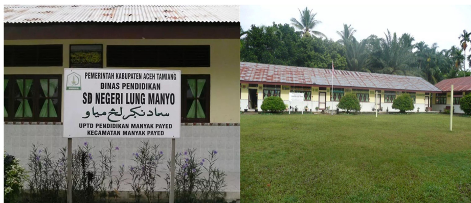
Gambar 1. SD Negeri Lung Manyo, Aceh Tamiang, Aceh