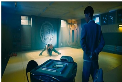
Gambar 1.3 Scane 40:50

Dalam konteks ini, perkelahian tidak hanya menggambarkan konflik antar geng, tetapi juga memperlihatkan bentuk ketaatan dan disiplin fisik yang muncul dari perintah dan respons. Setiap gerakan, pukulan, dan perlawanan menjadi simbol dari kekuatan dan hierarki yang berlaku di antara mereka.