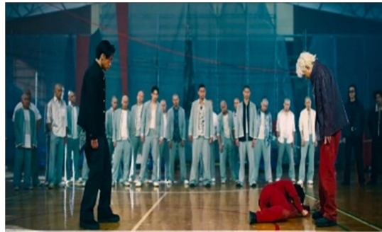
Gambar 1.6 Scene 1:45:59

Suzaki : すいません... お役に立てず... 強いつすね... 鬼邪高.....俺たち これから 鬼邪高の駒つすね俺たち これから 鬼邪高の駒つすね