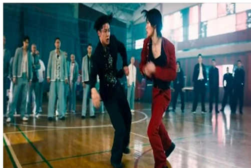
Gambar 1.9 Scene 1:39:13

Adean ini berlangsung setelah bentrokan antara Housen dan pihak Senomon. Anggota Housen saat itu sedang berada dalam posisi defensif, menunjukkan kemarahan dan kesedihan karena Shida Ken telah dipukuli. Momen ini terjadi sebelum pertarungan puncak. Fujio Hanaoka memutuskan untuk mengajak geng Housen bergabung untuk menantang kekuasaan dominan Senomon. Pada awalnya, Oya High dipandang sebagai kelompok lemah dan tidak terorganisir, berada dalam posisi marginal di bawah dominasi Senomon. Namun, melalui kepemimpinan Fujio, mereka membangun perlawanan terhadap Suzaki dan geng Senomon dengan tujuan membalikkan hierarki kekuasaan. Tindakan Fujio ini mencerminkan counter discourse, di mana ia menolak status quo yang mendefinisikan Oya High sebagai pihak yang lemah. Dengan melibatkan Housen, Fujio tidak hanya menyatukan kekuatan fisik tetapi juga menciptakan narasi baru tentang kekuatan dan solidaritas, memperjuangkan perubahan posisi dari yang terpinggirkan menjadi yang dominan.