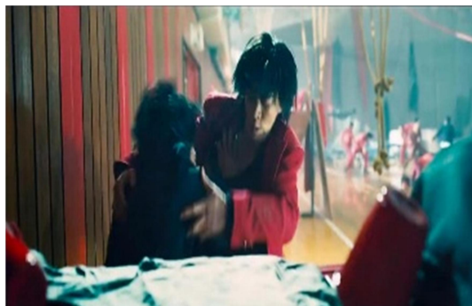
Gambar 1.7 Scene 1:32:36

Konsep dominant–marginal berkaitan dengan bagaimana kekuasaan mengatur posisi sosial kelompok atau individu dalam suatu sistem hierarki.