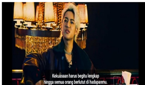
Gambar 1.1 Scene 22:28

Relasi kuasa atas pikiran menggambarkan bagaimana kekuasaan bekerja melalui pengaruh terhadap cara seseorang berpikir, bertindak, dan menilai sesuatu. Kekuasaan tidak tampak secara langsung, tetapi hadir dalam bentuk pengendalian pola pikir dan pandangan hidup individu sehingga mereka menyesuaikan diri dengan nilai dan aturan yang berlaku tanpa merasa dipaksa. Dalam situasi ini, kepatuhan muncul bukan karena rasa takut terhadap hukuman, melainkan karena kesadaran yang telah dibentuk agar sejalan dengan kepentingan pihak yang berkuasa.