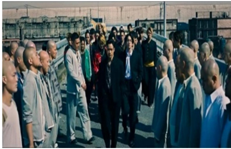
Gambar 1.8 1:14:34