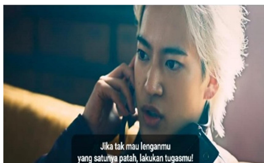
Gambar 1.4 Scene 1:19;34

Proses ini menunjukkan bagaimana individu didisiplinkan melalui pengendalian fisik. Dengan membiasakan tubuh pada kekerasan dan ketaatan, latihan ini memperlihatkan bahwa tubuh bukan hanya milik individu, tetapi juga menjadi media untuk menegaskan kekuasaan sosial. Disiplin yang ditanamkan melalui latihan keras menunjukkan bagaimana kontrol dapat bekerja secara halus namun kuat dalam mengatur perilaku dan fungsi tubuh dalam kelompok.