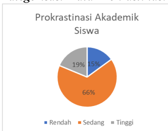
Tabel 6. Hasil Kategorisasi Data Prokrastinasi Akademik Siswa

Berdasarkan Tabel 5 dapat diketahui bahwa prokrastinasi akademik siswa akan dikategorikan tinggi apabila memperoleh nilai 109 ke atas; dikategorikan sedang apabila memperoleh nilai lebih dari 73 dan kurang dari 109; serta dikategorikan rendah apabila memperoleh nilai 73 ke bawah. Pemaparan hasil data berdasarkan kategorisasi tersebut dapat dilihat pada Tabel 6.