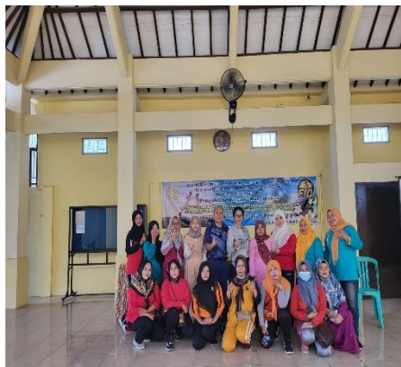
Gambar 8. Acara foto bersama Penutupan PKM