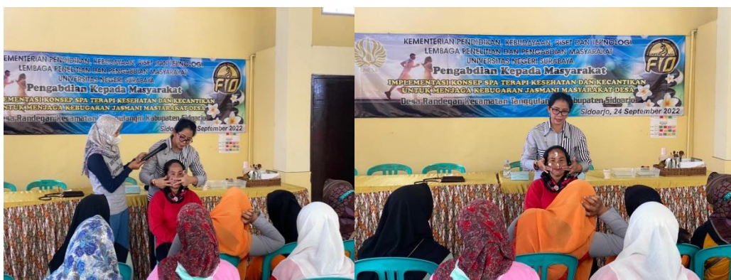
Gambar 6. Praktek penggunaan Aplikasi Sistem Gizi