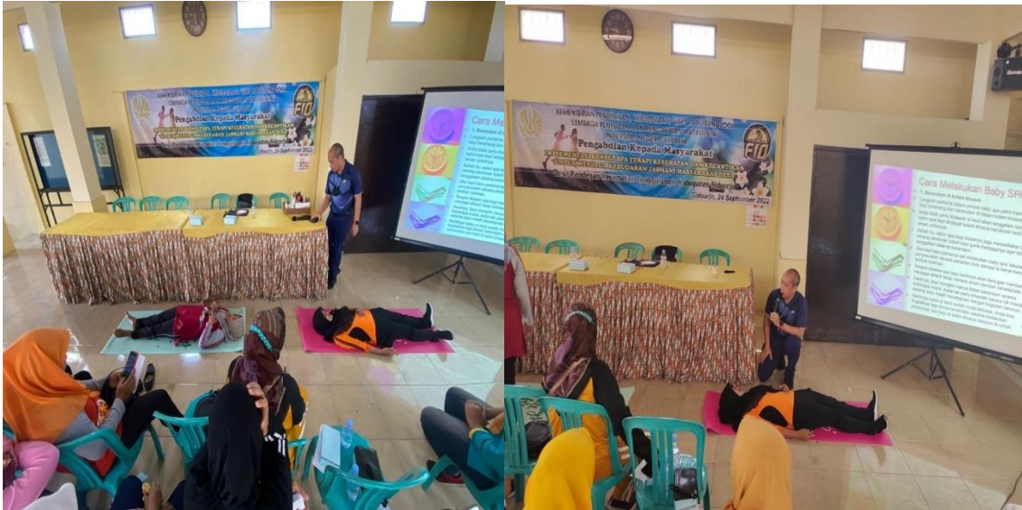
Gambar 4. Praktek Spa Terapi diluar ruangan