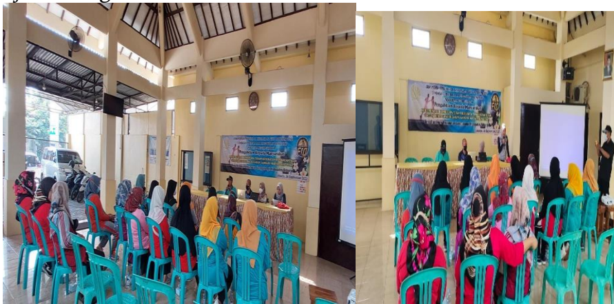
Gambar 2. Pembukaan PKM

Kegiatan berlangsung mulai pukul 08.00 hingga 12.00 dengan peserta sebanyak 30 Ibu-ibu PKK Desa Randegan Kecamatan Tanggulangin Kabupaten Sidoarjo. Kegiatan berjalan dengan tertib dan lancar.