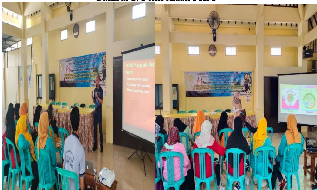
Gambar 3. Penyampaian Materi dari Nara Sumber di Desa Randegan