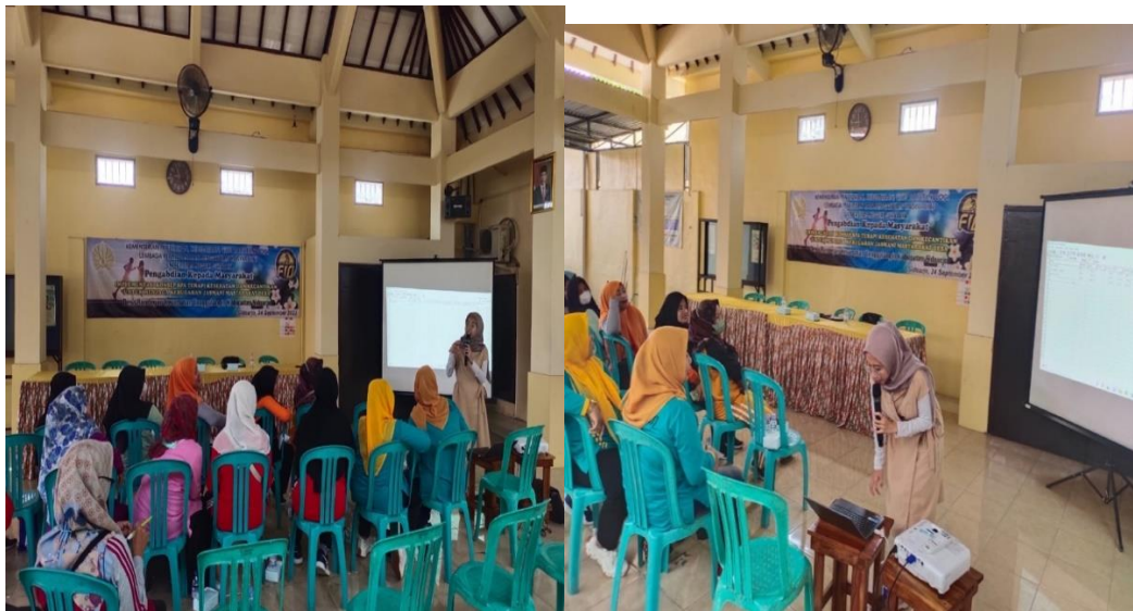
Gambar 5. Praktek penggunaan Aplikasi Sistem Gizi