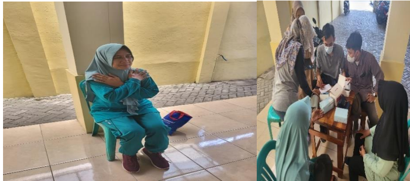
Gambar 7. Praktek Data Kesehatan dan Tes Kebugaran Jasmani

Peserta PKM melakukan tugas gerak selama dua minggu dan menuliskan kegiatan atau bentuk aktivitas fisik intensitas sedang yang telah dilakukan minimal tiga kali perminggu. Bentuk kegiatan berupa catatan maupun video dikirimkan melalui grup whatsapp . Tim PKM melakukan pendampingan secara berkala untuk memastikan peserta melakukan tugas geraknya. Berdasarkan tes kebugaran jasmani dengan 30 second chair stand test yang telah dilakukan kepada Ibu-ibu PKK Desa Randegan, Kecamatan Tanggulangin, Kabupaten Sidoarjo didapatkan hasil sebagai berikut.