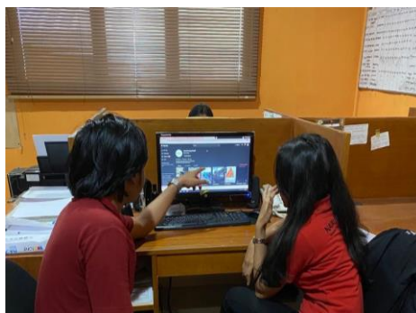
Gambar 2: Memberikan pengarahan dan pelatihan mengenai digital marketing melalui platform social media (TikTok)