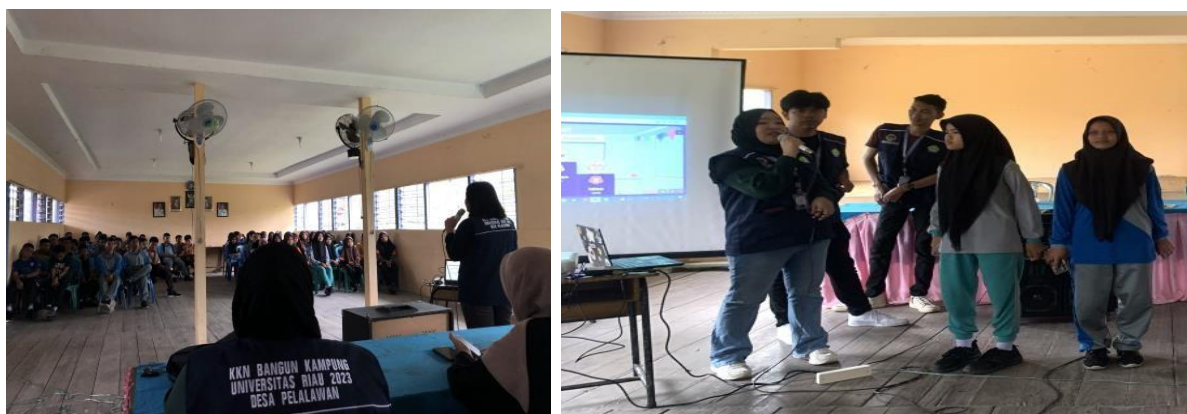
Gambar 3. Sosialisasi Media Digital kepada Siswa/i SMPN 1 Pelalawan

Pengenalan media digital dalam konteks pendidikan telah mengubah lanskap pembelajaran secara mendalam. Era teknologi informasi yang terus berkembang telah membawa perubahan signifikan dalam cara siswa dan pengajar berinteraksi dengan konten pembelajaran, berkolaborasi, dan mengakses informasi. Media digital, yang mencakup berbagai bentuk teknologi dan perangkat, telah membuka peluang baru untuk meningkatkan kualitas pembelajaran, menyesuaikan pendekatan pembelajaran, dan merangsang rasa ingin tahu siswa.