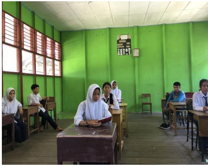
Gambar 2. Wawancara Siswa/i SMPN 1 Pelalawan terkait metode pembelajaran berbasis media digital

Untuk menemukan korelasi antara penggunaan media digital dalam proses pembelajaran dengan peningkatan semangat belajar siswa, tim peneliti melakukan studi kasus terhadap siswa dan siswi SMPN 1 Pelalawan melalui beberapa kegiatan yang dilaksanakan di dalam lingkungan sekolah. Beberapa kegiatan tersebut ialah sosialisasi manfaat sosial media bagi pengembangan diri, post-test menggunakan website quiz kahoot, serta survei dan wawancara terhadap siswa dan siswi SMPN 1 Pelalawan. Dari kegiatan tersebut, tim peneliti berhasil melakukan observasi terhadap tingkat semangat belajar siswa/i SMPN 1 Pelalawan dan keterkaitannya dengan metode pembelajaran yang digunakan dalam proses belajar mengajar di sekolah tersebut. Setelah melakukan observasi dan survei, tim peneliti berusaha untuk menganalisis ketertarikan peserta didik di sekolah tersebut terhadap pembelajaran yang berbasis media digital.