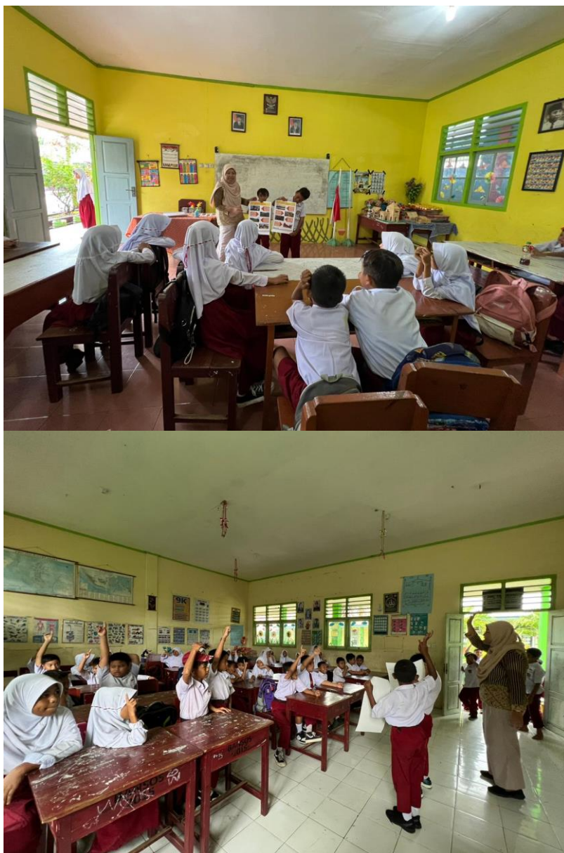
Gambar 3. Kegiatan Pengenalan Cagar Budaya Kota Ternate pada siswa SDN 50 Kota Ternate

bercerita mengenai objek yang mereka kenali. Peserta diminta untuk menunjukkan di mana objek-objek itu berada, apakah dekat dengan tempat tinggal atau sekolah tempat mereka belajar.