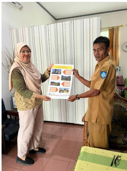
Gambar 4. Penyerahan poster Cagar Budaya Kota Ternate kepada SDN 50 Kota Ternate

Kegiatan sosialisasi dilanjutkan dengan penyerahan poster kepada pihak sekolah. Poster yang ditampilkan dalam sosialisasi diserahkan kepada pihak sekolah agar dapat di tempel di kelas-kelas. Dengan demikian siswa akan lebih mudah mengingat bangunan-bangunan cagar budaya yang ada di Kota Ternate.