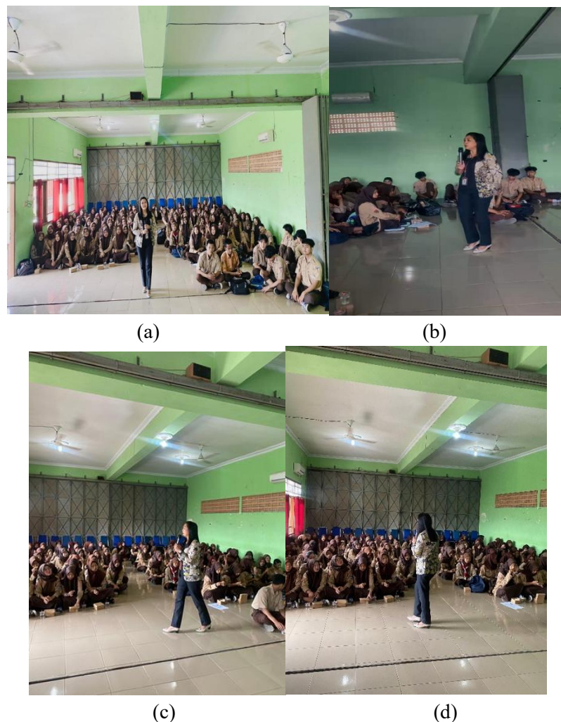
Gambar 1. Penyuluhan dan Pelatihan Kegiatan Pengabdian Komunikasi Efektif di SMK Wijaya Kusuma Surakarta, Jumat, 13 Juni 2025.

Dalam implementasinya, siswa menunjukkan peningkatan yang cukup nyata pada berbagai aspek. Berdasarkan hasil observasi selama kegiatan serta umpan balik dari guru pendamping, siswa yang sebelumnya cenderung pasif dan kurang percaya diri menjadi lebih aktif dalam berkomunikasi serta mampu menyampaikan gagasan secara terstruktur. Hal ini tampak pada saat simulasi wawancara kerja, di mana sebagian besar peserta mampu memperkenalkan diri, menguraikan pengalaman, serta menyampaikan tujuan kerja secara runtut dan dengan tingkat kepercayaan diri yang lebih baik (Lestari & Prasetyo, 2020; Suhendra, 2024).