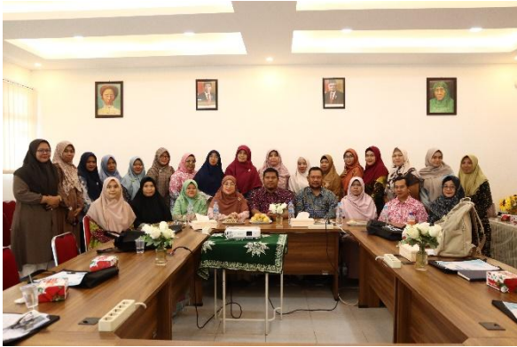
Gambar 2. Pembukaan dan sambutan oleh Dekan FMIPAKes dan pihak PHR