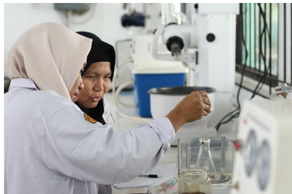
Gambar 5. Peserta melakukan penimbangan sampel gravimetri