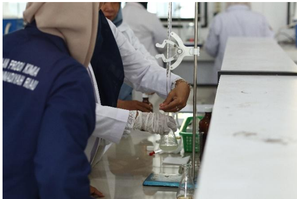
Gambar 6. Peserta melakukan praktik titrasi secara bergantian