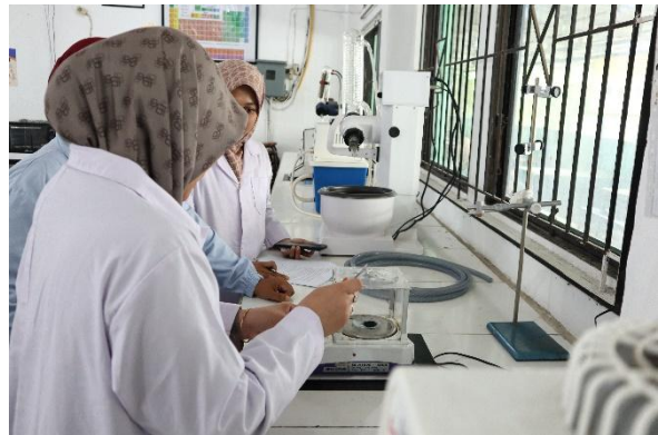
Gambar 7. Peserta melakukan praktik penimbangan adsorben