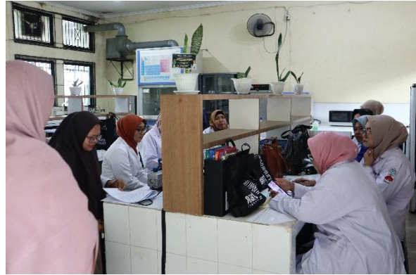
Gambar 3. Penjelasan safety induction dari modul K3 oleh Asisten Laboratorium