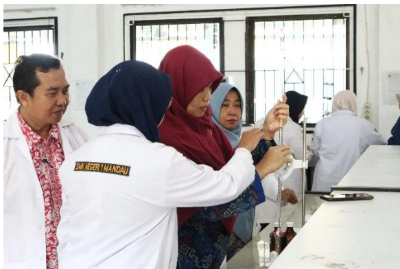
Gambar 4. Penjelasan dan praktik volumetri didampingi langsung oleh Dosen Pemateri