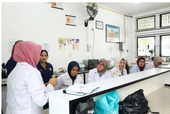
Gambar 8. Penjelasan teknik adsorpsi oleh Dosen Pemateri