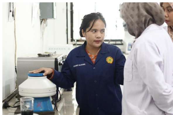
Gambar 9. Praktik adsorpsi oleh peserta didampingi oleh Asisten Laboratorium