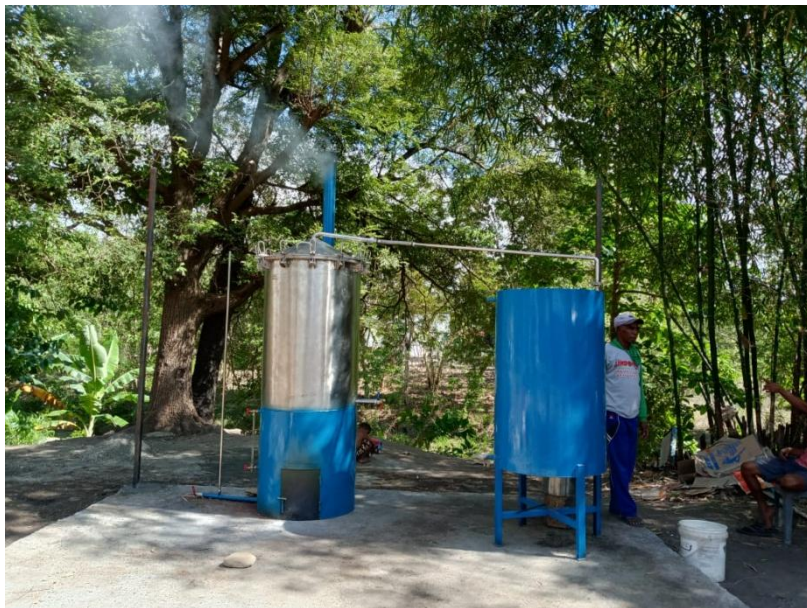
Gambar 7. Proses Destilasi

Penyulingan minyak kayu putih menggunakan destilator uap metode kukus berbahan anti karat ( stainless steel ). Tahapan proses destilasi antara lain pengisian air pada kondensor dan wadah untuk pemanas air. Kebutuhan air pada kondensor sebanyak 1200 liter. Proses penyulingan dilakukan dengan total bahan baku yang dimasukkan kedalam sebanyak 100 Kg. Umur panen daun kayu putih yang digunakan sebagai bahan baku berumur 2 tahun. Proses penyulingan dilakukan selama 4-5 jam. Waktu yang dibutuhkan untuk keluarnya minyak dari hasil destilasi yakni 1 jam setelah proses penyulingan dimulai. Rendemen minyak yang dihasilkan dari jumlah bahan baku sebanyak 100 kg yakni 1500 ml (1,5 liter) minyak kayu putih murni. Rendemen minyak kayu putih yang dihasilkan dalam proses penyulingan selama 4-5 jam sebesar 1.5%.