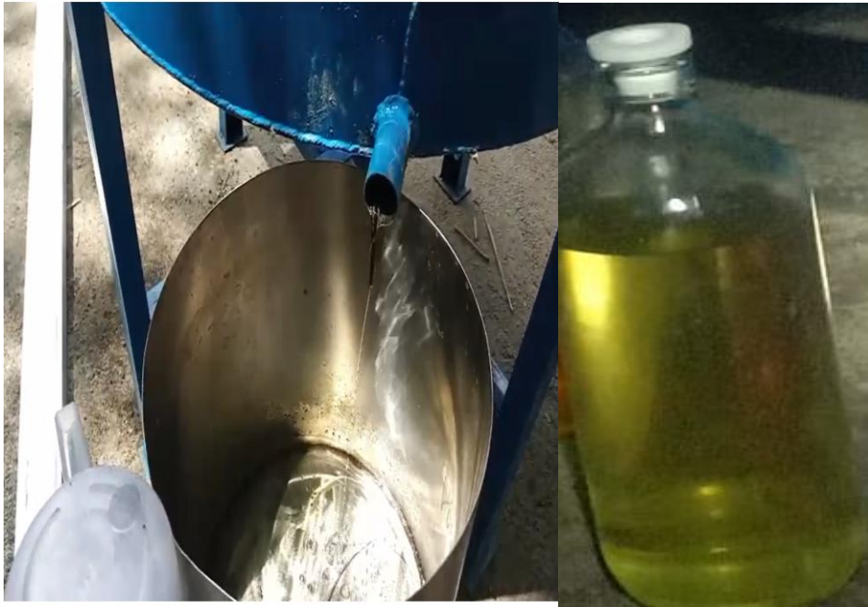
Gambar 8. Rendemen Minyak Kayu Putih

Permasalahan mendasar yang dialami oleh kelompok tani yakni penggunaan alat destilasi berbahan drum karat dengan sistem pendingin yang kurang efektif. Selain itu juga bahan baku yang dipanen langsung dimasukkan dalam drum destilator tanpa dilakukan pelayuan sehingga berdampak pada pencapaian rendemen minyak kayu putih yang masih relatif rendah. Menurut penelitian (Sembiring and Manoi, 2015) menyatakan bahwa lama pelayuan berpengaruh terhadap kadar air, semakin lama serai wangi dilayukan, maka kadar airnya semakin kecil. Perbandingan rendemen dan kualitas minyak kayu putih hasil destilasi secara konvensional dan destilasi dengan penggunaan alat destilator uap metode kukus berbahan anti karat ( stainless steel ) dapat dilihat pada Tabel 1.