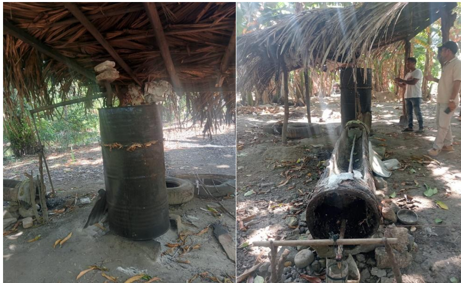
Gambar 2. Model Alat Penyulingan Konvensional Kelompok Tani Faot Bano