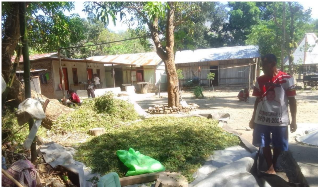
Gambar 5. Pelayuan Duan dengan Kering Angin

Proses pelayuan dengan cara dikering anginkan dilakukan selama 1 hari (24 jam). Tahapan selanjutnya setelah pelayuan yakni penimbangan bahan baku sesuai dengan kapasitas alat destilasi. Kapasitas alat destilasi dalam satu kali proses penyulingan yakni 100 Kg. Kegiatan penimbangan juga dimaksudkan untuk memudahkan perhitungan rendemen minyak sereh yang dihasilkan.