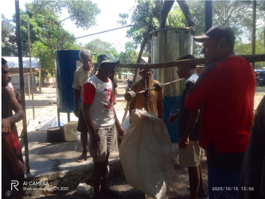
Gambar 6. Penimbangan Bahan Baku

Penyulingan minyak kayu putih menggunakan destilator uap metode kukus berbahan anti karat ( stainless steel ). Tahapan proses destilasi antara lain pengisian air pada kondensor dan wadah untuk pemanas air. Kebutuhan air pada kondensor sebanyak 1200 liter. Proses penyulingan dilakukan dengan total bahan baku yang dimasukkan kedalam sebanyak 100 Kg. Umur panen daun kayu putih yang digunakan sebagai bahan baku berumur 2 tahun. Proses penyulingan dilakukan selama 4-5 jam. Waktu yang dibutuhkan untuk keluarnya minyak dari hasil destilasi yakni 1 jam setelah proses penyulingan dimulai. Rendemen minyak yang dihasilkan dari jumlah bahan baku sebanyak 100 kg yakni 1500 ml (1,5 liter) minyak kayu putih murni. Rendemen minyak kayu putih yang dihasilkan dalam proses penyulingan selama 4-5 jam sebesar 1.5%.