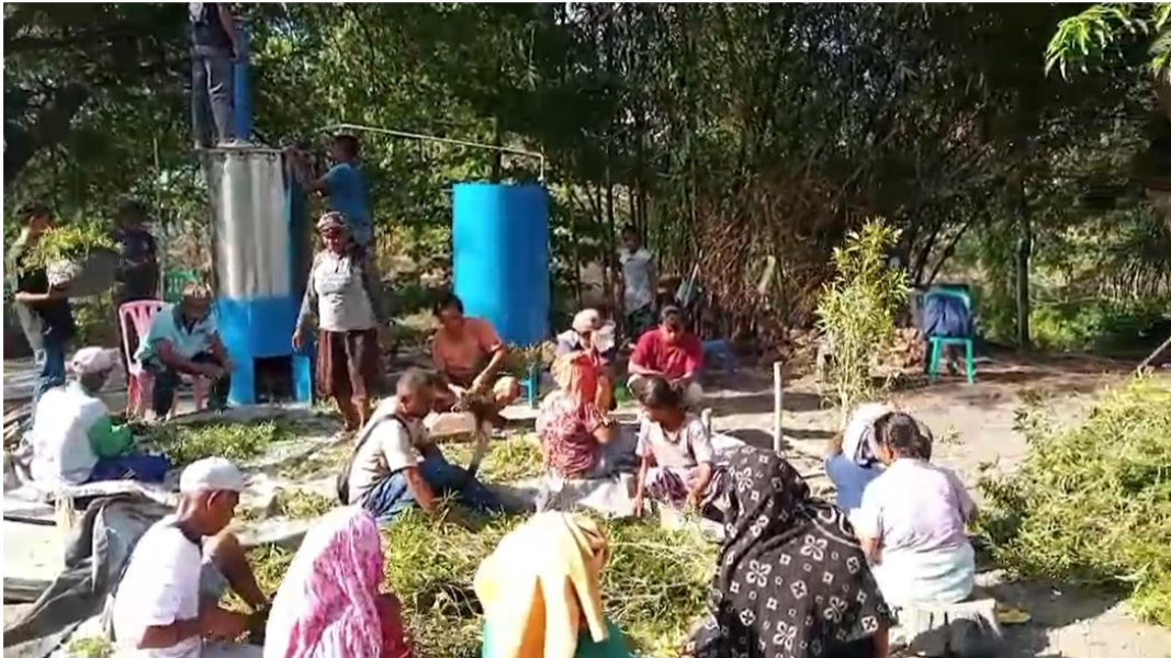
Gambar 4. Prontokan Daun

Luas lahan yang dikelola kelompok tani Faot Bano untuk ditanami kayu putih sebagai bahan baku dengan luas lahan \pm 5 Ha. Pelaksanaan kegiatan dimulai dengan kegiatan penyiapan bahan baku. Penyiapan bahan baku dilakukan dengan pemanenan daun kayu putih perontokan daun dan pelayuan. Perontokan dan pelayuan dilakukan untuk mengurangi kadar air dalam kelenjar bahan, sehingga proses ekstraksi minyak atsiri menjadi lebih efisien. Kegiatan prontokan daun dan pelayuan dengan kering angin dapat dilihat pada Gambar 4 dan Gambar 5.