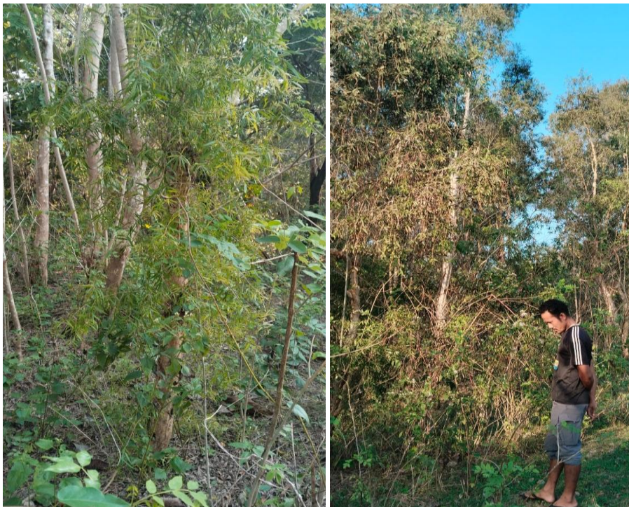
Gambar 1. Tanaman Kayu Putih yang Di Budidayakan Kelompok Tani Faot Bano