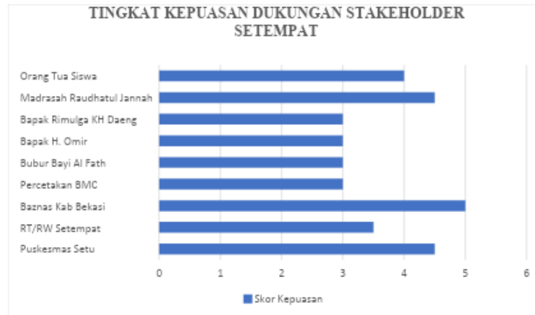
Gambar 3. Hasil Evaluasi Tingkat Kepuasan Dukungan Stakeholder Setelah 1 Bulan

lokal melihat program ini sebagai inisiatif yang produktif dan berpotensi memberikan nilai tambah bagi lingkungan sekitar. Hasil ini menunjukkan bahwa pendekatan berbasis analisis stakeholder mampu memperkuat jejaring kolaborasi dan meningkatkan rasa kepemilikan terhadap program edukasi. Namun beberapa stakeholder seperti RT/RW setempat dan tokoh masyarakat mendapatkan skor sedang yaitu 3. Hal ini dapat mencerminkan adanya kebutuhan peningkatan komunikasi, koordinasi, dan pelibatan yang lebih intensif dalam kegiatan kedepannya. Temuan ini mendukung efektivitas pendekatan stakeholder engagement sebagai metode yang strategis dalam keberlanjutan program pemberdayaan masyarakat.