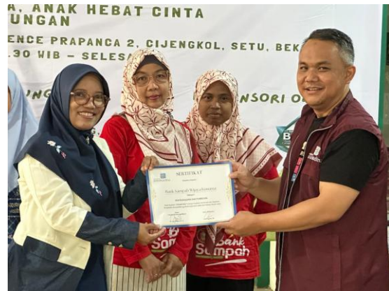
Gambar 7 Penyerahan Simbolisasi kepada Stakeholders