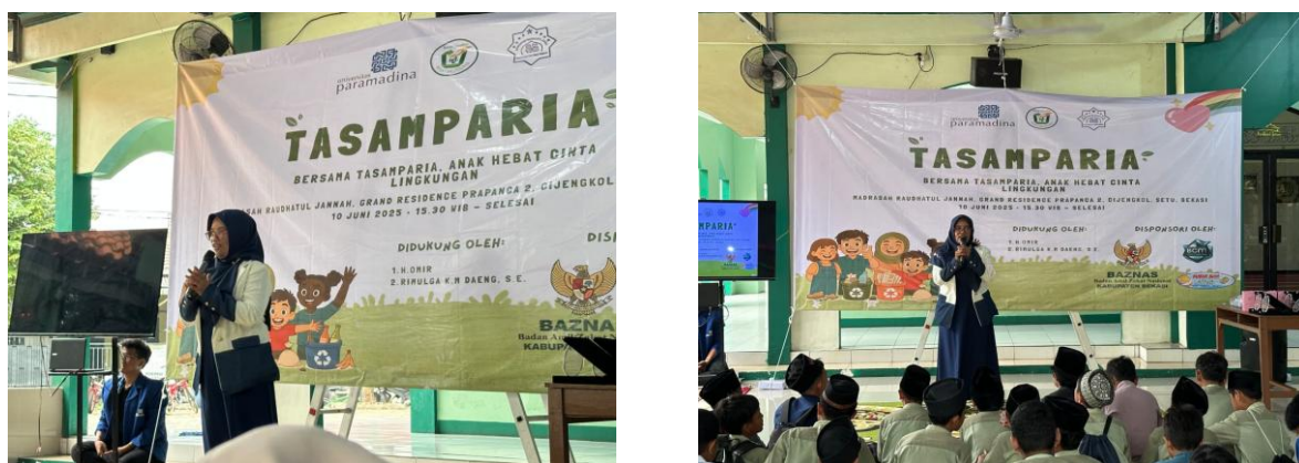
Gambar 2 Sosialisasi Bank Sampah Oleh Bank Sampah Wijayakusuma