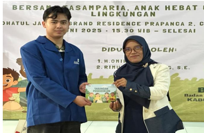
Gambar 6 Penyerahan Buku Tabungan kepada Bank Sampah Wijaya Kusuma