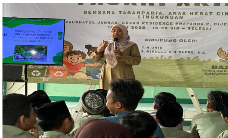
Gambar 4 Sosialisasi Kesehatan Lingkungan dari Puskesmas