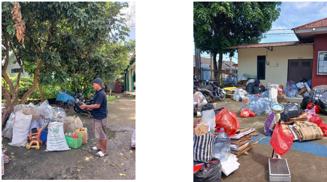
Gambar 1 Implementasi Perhitungan Sampah Pertama