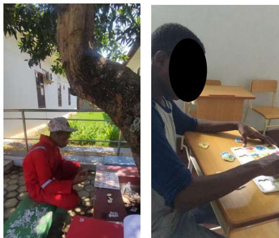
Gambar 1. Pengenalan angka

Pada tahap 1 dilakukan guna mengenalkan pada anak permainan apa yang dilakukan, dalam hal ini media puzzle angka. Tim kemudian mengenalkan pada masing-masing anak mengenai angka, mulai dari satuan hingga puluhan. Setelah itu tim kemudian mengetes anak dengan cara penyebutan angka secara berurut hingga acak. Tujuan pada tahap ini yaitu diharapkan pada anak mampu membedakan angka satuan dan puluhan, sehingga anak tidak akan bingung ketika menemukan angka lebih tinggi dari 9.