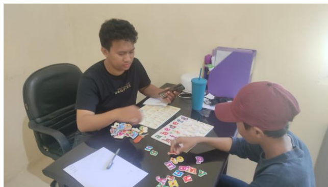
Gambar 4. Tahap penguatan

Pada tahap ini dilandasi dengan teori penguatan ( reinforcement theory ). Penguatan akan mempengaruhi individu berdasarkan pengalaman langsung atau dengan mengamati sesuatu yang sedang terjadi (Monte & Sollod, 2003). Penguatan berfungsi agar apa yang dipelajari oleh PPKS bisa melekat dengan baik pada dirinya dan merasa senang ketika sudah lancar dalam membaca. Pada tahap ini penulis memberikan pengulangan dengan beberapa kali seperti yang telah dijelaskan pada tahap Meniru. Selain itu, penulis juga menguji PPKS untuk menyebutkan huruf secara berurutan hingga secara acak. Hal ini dilakukan guna melatih memori anak dalam mengingat huruf tidak hanya dari segi urutan, namun anak juga harus mampu membedakan huruf dari segi penyimbolan. Misalnya yaitu anak harus mampu membedakan huruf "M" dan "N" atau membedakan pengucapan huruf "F" dan "V".