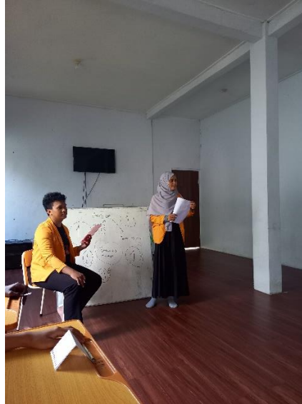
Gambar 2. Pelaksanaan psikoedukasi

Penulis dalam kegiatan ini membagi dua langkah dalam pelaksanaannya, yaitu psikoedukasi dan eksperimen. Psikoedukasi diberikan untuk menjelaskan mengenai pentingnya membaca, cara mengatasi ketika bosan membaca, dan mengetahui siapa saja yang minat untuk belajar membaca. Dari 5 PPKS yang dilibatkan dalam psikoedukasi, hanya 3 yang mengangkat tangannya, sehingga 3 PPKS tersebut yang akan dilibatkan dalam tahap eksperimen. Tahap eksperimen ini akan kembali dibagi dalam 3 tahap dan akan menggunakan media puzzle sebagai perlakuan yang diberikan.