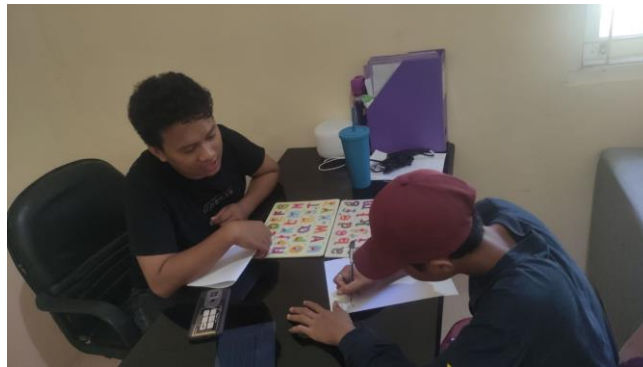
Gambar 3. Tahap meniru

Pada tahap ini dilandasi dengan teori Kognisi Sosial dari Bandura yang menjelaskan bahwa individu bertindak di lingkungan dan dipengaruhi oleh pemahaman mereka tentang hal tersebut (Monte & Sollod, 2003). Teori ini menjelaskan bahwa individu akan mengamati dan mempelajari banyak hal di sekitarnya. Pada tahap ini, PPKS akan mengamati bagaimana penulis memperagakan puzzle dengan cara menyebutnya. Hal ini ditandai ketika penulis mengucapkan huruf "A", maka PPKS juga mengatakan huruf yang sama.